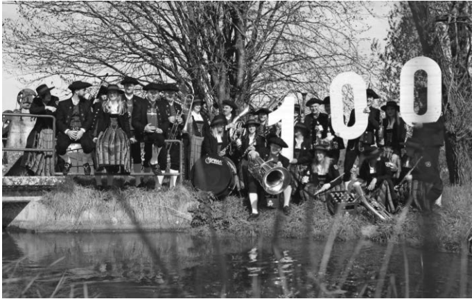
Am Wochenende feiert der MV Reinstetten sein 100-jähriges Bestehen mit einem abwechslungsreichen Programm.

Besuchen Sie uns auch bei Facebook und Instagram.